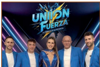
Orquesta UNIÓN Y FUERZA

21:00 h. ORQUESTRAS UNIÓN Y FUERZA E MARBELLA