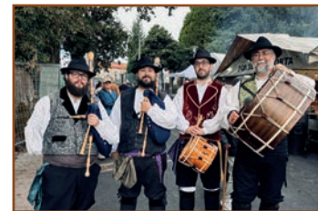
Grupo de Gaitas Airiños do Petouto