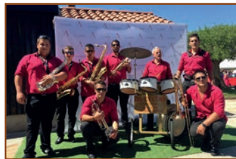
Charanga Os Celtas

19:00 h. ACTUACIÓN DAS ESCOLAS DE BAILE E MÚSICA TRADICIONAL DO CONCELLO DE BRIÓN