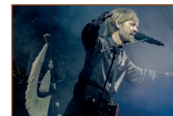
BUDIÑO · Xira "Branca Vela"