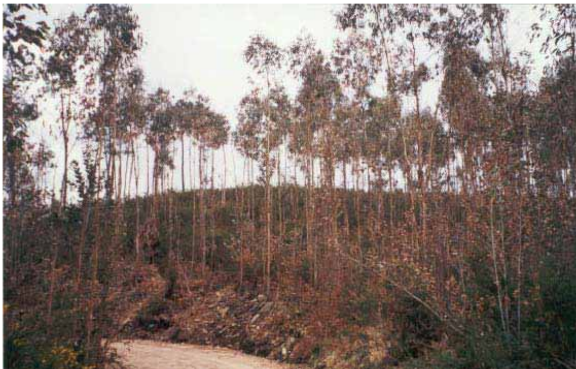
CATÁLOGO DE BENS CULTURAIS DO CONCELLO DE BRIÓN