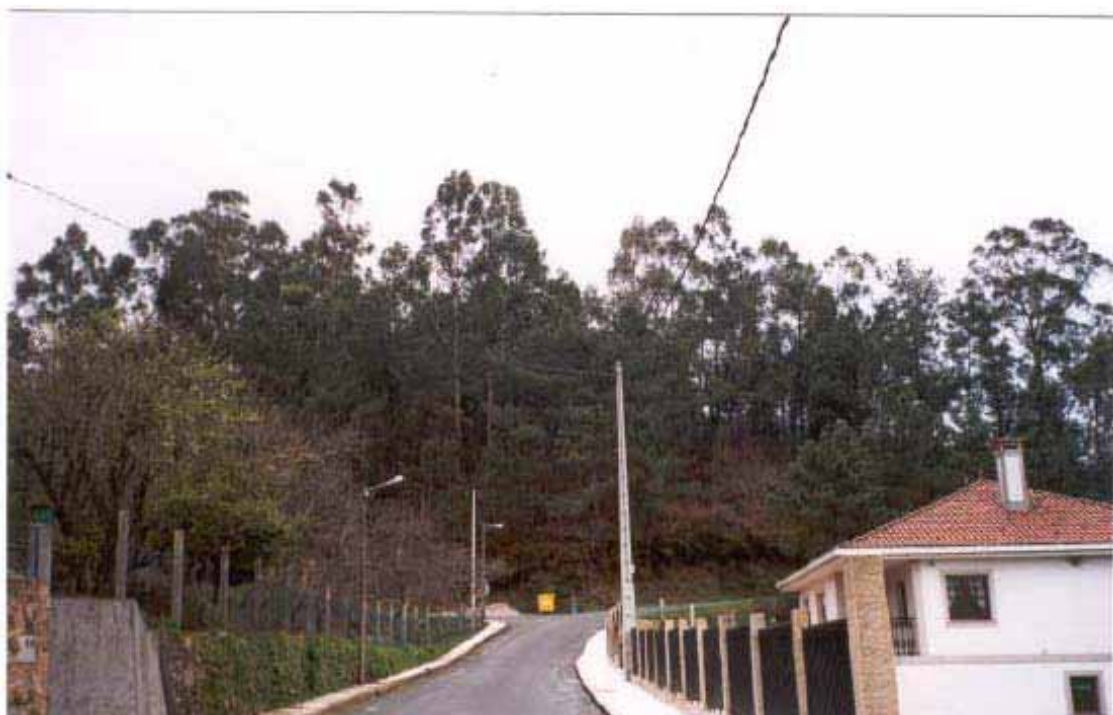
CATÁLOGO DE BENS CULTURAIS DO CONCELLO DE BRIÓN